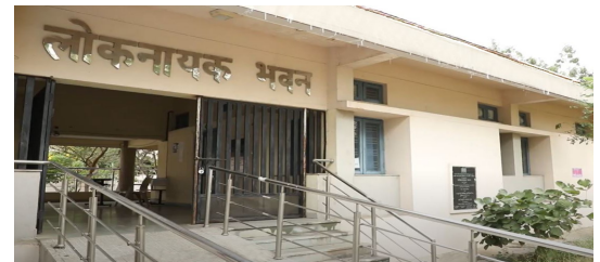
प्रवेश-विवरणिका (स्नातक एवं परास्नातक कार्यक्रम) 2024-25