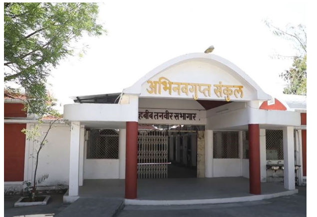
प्रवेश-विवरणिका (स्नातक एवं परास्नातक कार्यक्रम) 2024-25