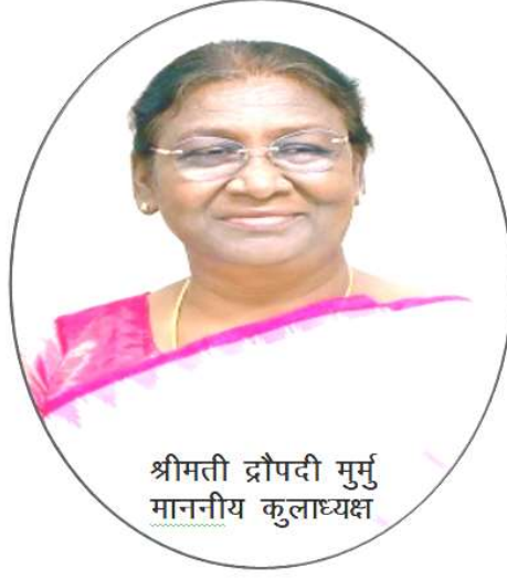
श्रीमती द्रौपदी मुर्मू माननीय कुलाध्यक्ष